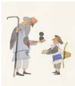
『ふしぎな たね』(部分) 1992年