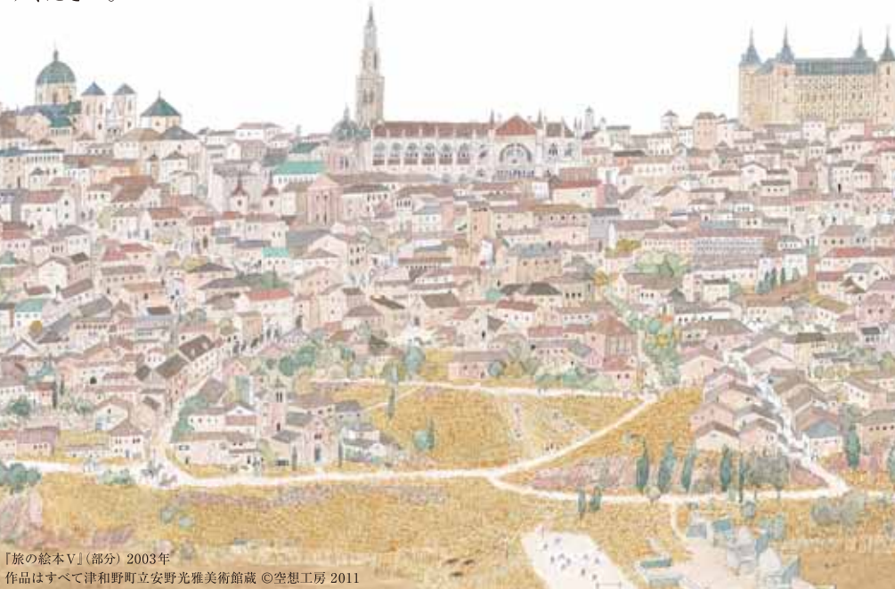
『旅の絵本V』(部分) 2003年 作品はすべて津和野町立安野光雅美術館蔵 ©空想工房 2011

本展は出身地に建つ安野光雅美術館(鳥根県津和野町)の開館10周年を記念し、同館の全面協力を得て実現しました。絵本界へのデビュー作『ふしぎなえ』の全点展示をはじめ、初期から近作までの名作絵本の原画を約200点展示し、半世紀におよぶ独創的な安野光雅の世界に迫ります。「ふしぎ」「数字」などのテーマを設けた構成と、遊び心あふれる楽しい展示空間によって、子どもから大人までわくわくドキドキできる展覧会です。家族や友達、大好きな人と一緒にぜひお楽しみください。