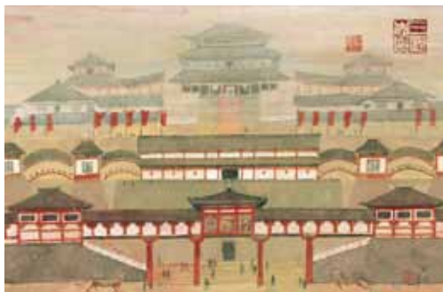
『繪本 三國志 長安夢幻』2008年

画家、絵本作家、装丁家として、多彩な活動を続ける安野光雅(1926年-)。40年以上にわたる幅広い創作活動の中から絵本作品を中心にをご紹介します。