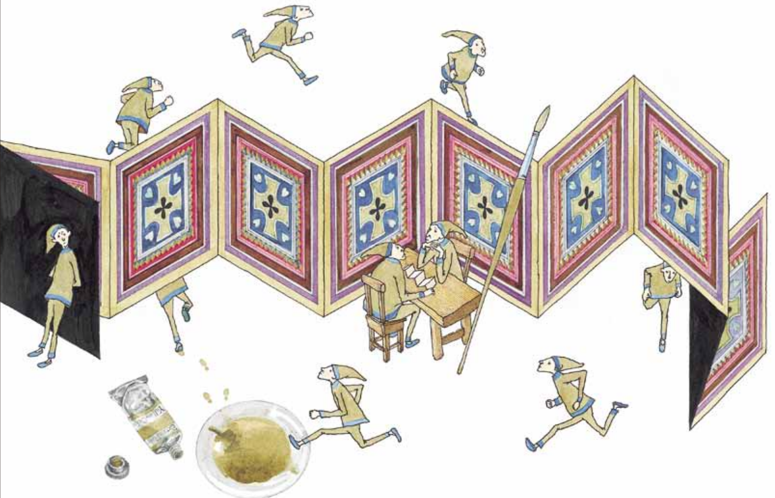
作品：上中段『ふしぎなえ』(部分) 1968年、中段『あいうえおの本』(部分) 1976年 すべて津和野町立安野光雅美術館蔵 ©空想工房 2011

主催：刈谷市美術館、朝日新聞社 企画協力：津和野町立安野光雅美術館 後援：愛知県教育委員会