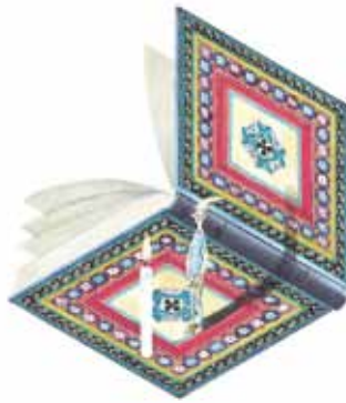
『ふしぎなえ』(部分) 1968年