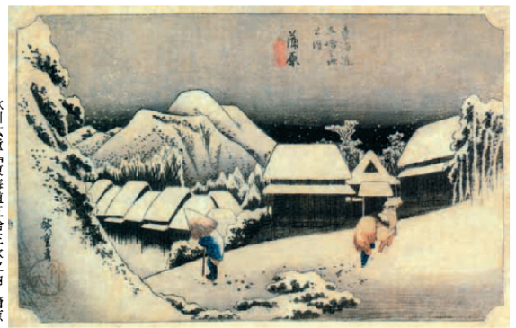
歌川広重「東海道五拾三次之内 蒲原」