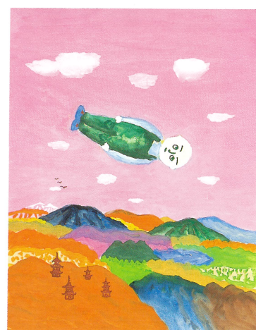
『コムあたまボンたろう』1998年 童心社 ちひろ美術館蔵