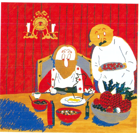
『おしゃべりなたまごやき』(改訂版) 1972年 福音館書店 宮城県美術館蔵