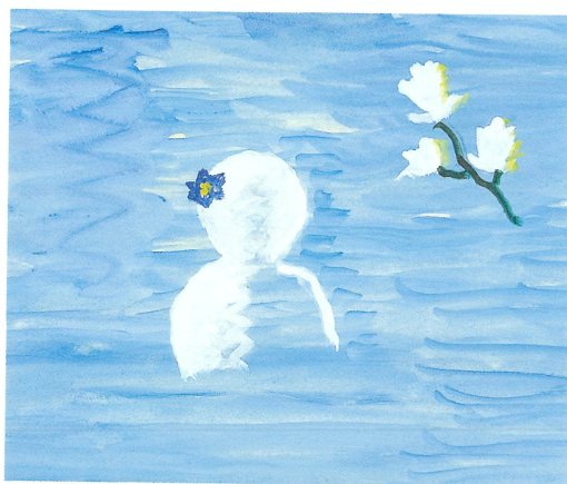
『くもの日記ちょう』2000年 ビリケン出版 ちひろ美術館蔵