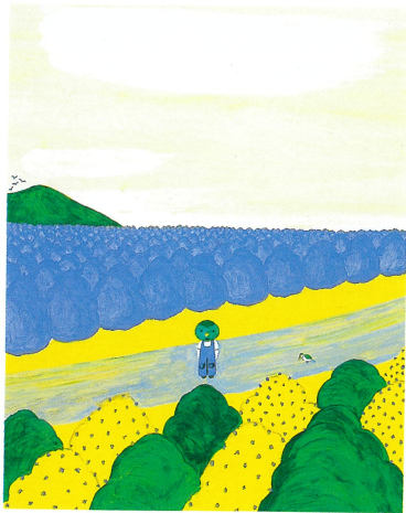
『キャベツくん』1980年 文研出版 ちひろ美術館蔵