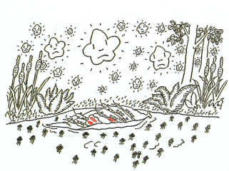
『ベタベタプンプンおおさわぎ』1963年 岩崎書店 個人蔵