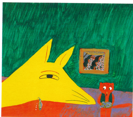
『きつねとかわうそ』1972年 世界文化社 ちひろ美術館蔵