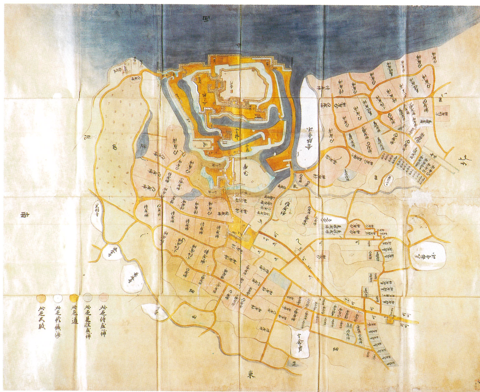
刈谷城絵図（中根家）

本展は、この時代の歴史資料約一〇〇余点を展覧し、戦国から江戸時代の刈谷を紹介いたします。