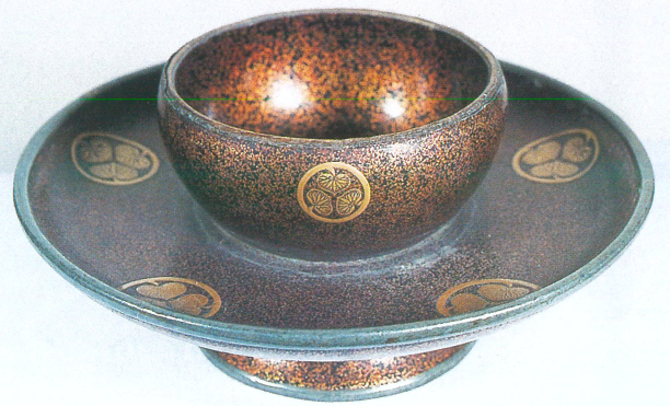
伝通院調度品 (楞嚴寺)