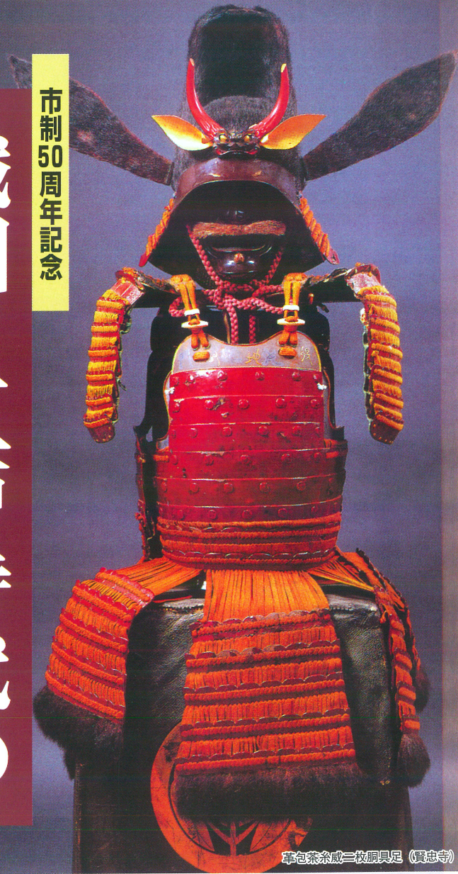
車包茶糸威三枚胴具足 (賢忠寺)