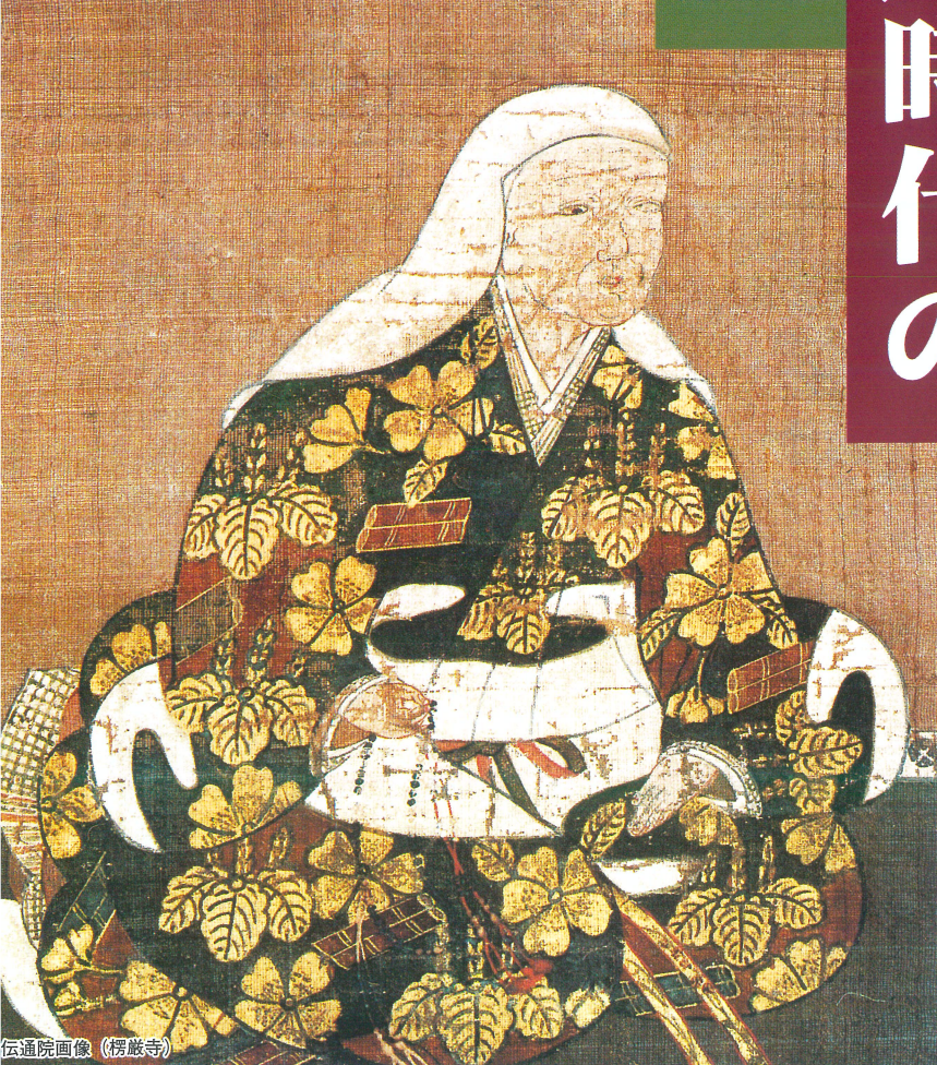
伝通院画像 (楞嚴寺)