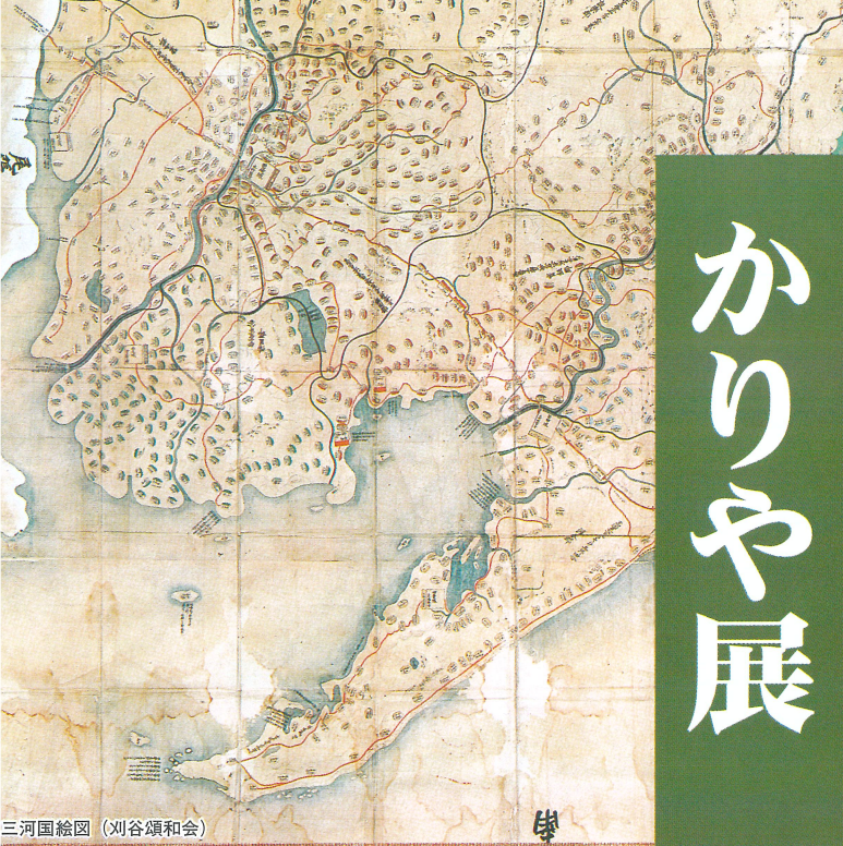
三河国絵図 (刈谷頌和会)