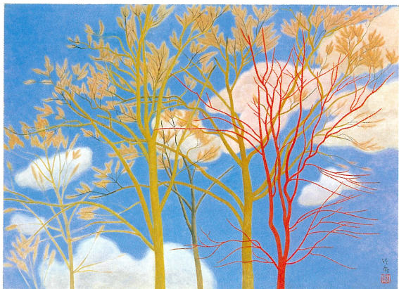
小野 竹喬【冬樹】1976年 山種美術館蔵