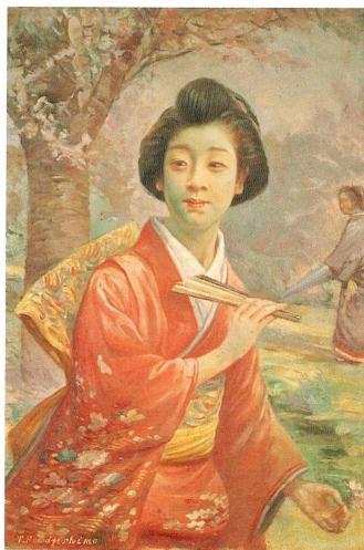
藤島 武二【桜の美人(桜狩下絵)】 1892~93年頃 石水博物館蔵