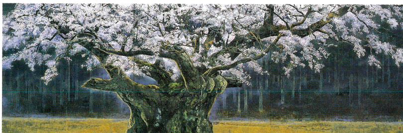
後藤 純男【淡墨桜】1987年 刈谷市美術館蔵