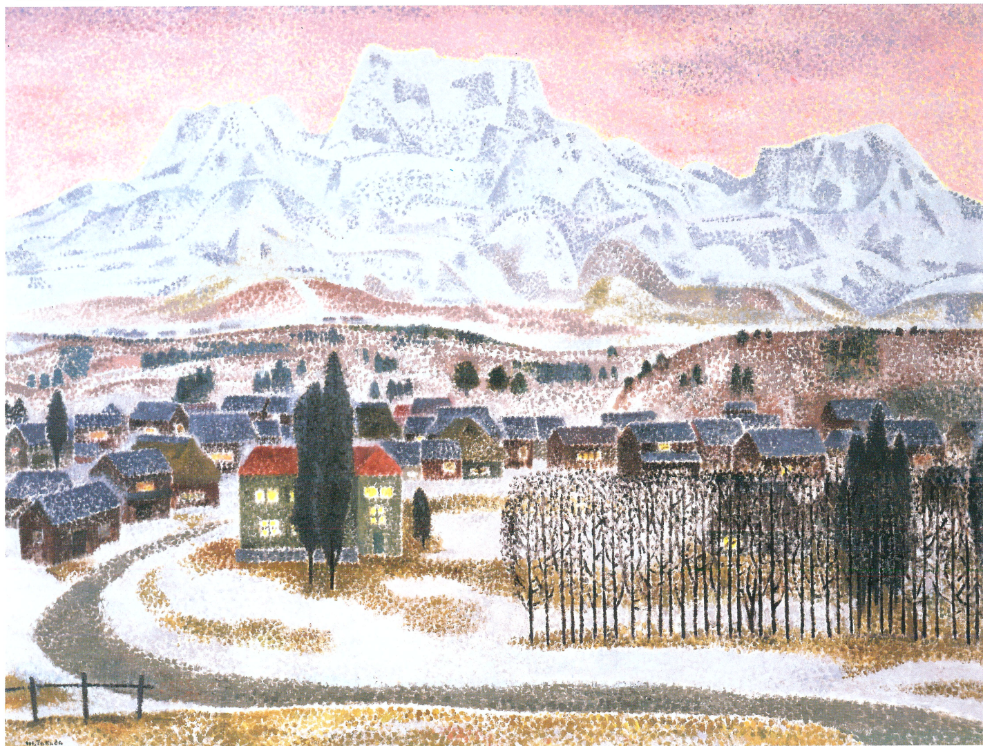
高田 誠 [残雪春色] 1971年 日本芸術院蔵