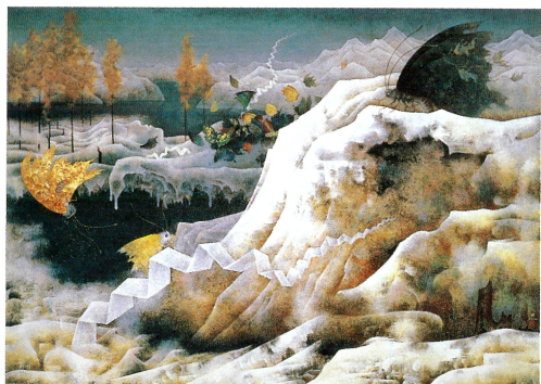
工藤 甲人【蝶の階段】1967年 平塚市美術館蔵