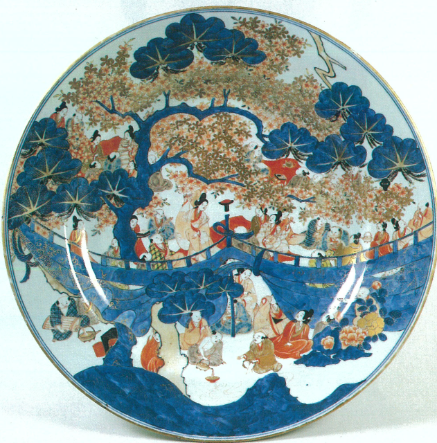
染錦桜下酒宴図大皿 伊万里

愛知県陶磁資料館は、陶磁器に関する資料を収集、展示、研究する総合施設として全国的に知られています。本展は愛知県陶磁資料館の収蔵品の中から、縄文時代より現代に至る100点を厳選し、美と機能性を求めて変遷する日本のやきものの流れをたどるものです。是非この機会に多くの方にご鑑賞くださいますようお願いいたします。