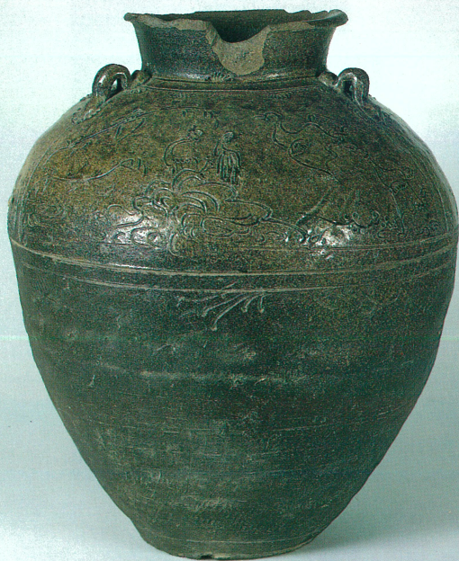
灰釉芦鶯文三耳壺 渥美