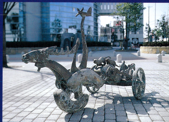
風の子・91・B 1991(平成3)年