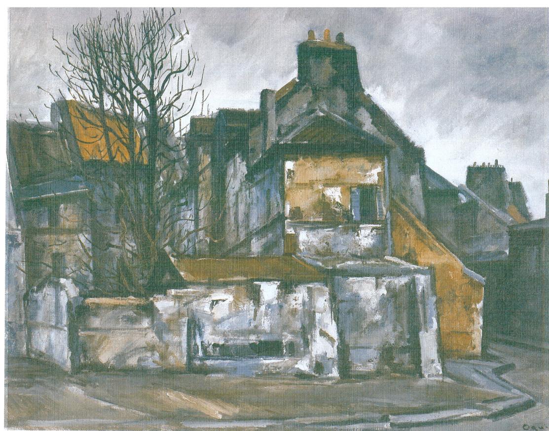
「サン・ドニ(2)」荻須 高德

●所在地 刈谷市住吉町4丁目5番地 TEL <0566>23-1636 JR東海、名鉄「刈谷駅」南口下車 徒歩7分 名古屋駅より刈谷駅まで22分 大府 駅より刈谷駅まで5分 安城 駅より刈谷駅まで8分 碧南 駅より刈谷駅まで25分