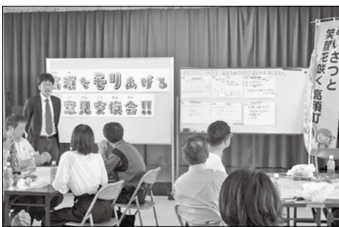
地域のことをみんなで一緒に考える住民会議

世間ギャップはいつの時代にも存在するが、今や社会環境変化のスピードが速すぎる。地域社会の仕組みが近い将来に破綻するのでは危惧している。地域が目指す姿をどう考えるか。 地域組織に対して求められる役割が多様化する一方で、住民同士の関係の希薄化、自治会加入率の低下、役員の高齢化、担手不足等の課題があることも事実である。しかしそのような中で、人と人がつながること、住民一人一人の暮らしや地域を共につくっていく社会が目指すべき姿だと考えている。 できるだけ当事者意識を持って世代にまちづくりの舵取