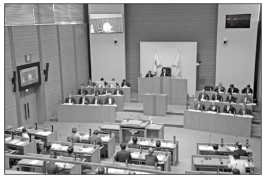
議会は市長の市政運営が適切に行われているかの審議を行い、条例制定などの重要事項を決定するとともに、市民の意思が市政に的確に反映されるよう市長に政策などを提案します。

市民の代表機関 議会は市長の市政運営が適切に行われているかの審議を行い、条例制定などの重要事項を決定するとともに、市民の意思が市政に的確に反映されるよう市長に政策などを提案します。 市長はこの決定や提案を受け、市民に行政サービスを提供します。 審議した議案などはこの4年間で434件以上のほりです。 審議した議案 332件 請願の審議 23件 陳情の審査 62件 可決した意見書 17件 審議した主な施策 ●民間活力を利用した保育所、集合住宅などを備えた複合施設を整備（銀座A B地区） ●刈谷駅北地区の市有地を活用し、活気にぎわいの創出を図るため、民間事業者が行う優良建築物等に対する補助