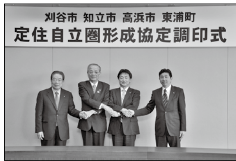
平成23年3月30日に行われた 定住自立圏形成協定調印式

3年前前、現東浦町長と市長の間で、次期東浦町長選のリーフレット等の選挙公約に刈谷市との合併あるいは近隣市との合併について記載するという、水面下の約束があったはずであるが。 話をさせていただいたことは事実である。 東浦町長とは、合併に向けて、同じ目的を持って進めるという話になっていた。東浦町だけでなく近隣市町との合併について、市長は水面下での努力をされてきた。その市政を次の市長にも継承していかなければならない。今後、新しい市長に交代しても、間違いなく、両市町が合併に向けた働きかけを行っていくのか。 合併は大変難しい事柄である。