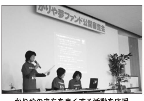
かりやのまちを良くする活動を応援（かりや夢ファンド公開審査会）

〔問〕 自助防災会活動の支援する補助率はいずれも5分の4で、それぞれに限度額が設けられている。 〔問〕 自助防災会活動の支援する補助率はいずれも5分の4で、それぞれに限度額が設けられている。