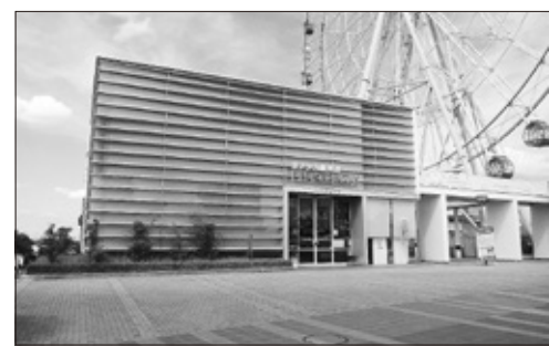
企画・立案から民間活力を取り入れ、より魅力ある施設に（オアシス館刈谷）

〔問〕 本市の不燃物理立場には4つの理立場がある。総面積は約10万㎡で港町グラウンドの約3.25倍となる広大な敷地である。その内、第1不燃物理立場（約2万㎡）は埋め立てを終え、覆土工事も完了し更地となっている。廃止に向けた今後の計画はどのようなものか。 〔答〕 平成29年3月に埋め立てを終了したため、県に埋立終了届を提出し、現在は、廃止に向けて埋立場から出る浸出水の検査等を行っている。最速で平成31年度当初に廃止届が提出できる。 〔問〕 理立場設置届出時の基本計画書では、跡地活用は「レジャー施設を備えた緑地公園」としている。法規制及び中部電力高圧線による制約条件はあるか。 〔答〕 当初の計画より不燃物理立容量が増加したため、高圧線との距離が近くなり、跡地利用については再度検討が必要となる。