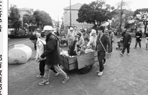
自助防災会の避難訓練の風景

〔問〕 現在の個別相談や勉強会を重ねている。公平性の観点から土地区画整理事業が望ましいと判断しており、事業化に向けては、権利者同士の合意形成が重要であるため、関係権利者などで組織するまちづくり協議会などの発足を視野に入れられている。 〔問〕 自助防災会活動の支援する補助制度としては、自助防災事業補助制度があり、防災資機材の整備経費を補助する防災資機材整備事業をはじめとした3種類の補助を設けている。また、補助率はいずれも5分の4で、それぞれに限度額が設けられている。