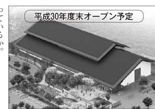
市の歴史に親しみ、学ぶことのできる拠点

〔問〕 自助防災会活動の支援する補助率はいずれも5分の4で、それぞれに限度額が設けられている。 〔問〕 自助防災会活動の支援する補助率はいずれも5分の4で、それぞれに限度額が設けられている。