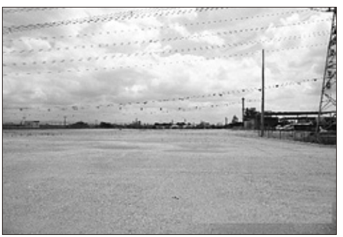
跡地の有効活用を（第1不燃物理立場）

〔問〕 愛知県地域防災計画の内容に抵触することのないよう、県の計画の修正にあわせて毎年見直しを行っている。県は、熊本地震の課題検証報告を踏まえ、平成29年5月末に愛知県地域防 〔主な答弁者〕：生活安全部長