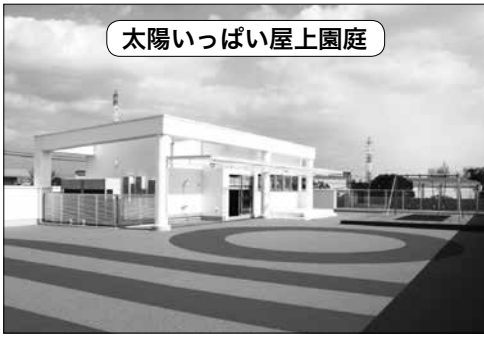
4月に開園した空のうさぎ保育園

神谷 昌宏 議員 保育園整備を推進する姿勢を評価。立ち止まることなく更なる支援充実を —国の取り組みを考慮しながら、適宜検討していく— 新年度の入园申込状況は。昨年度から約160名増え、約760名である。 29年度は110名、30年度は225名の定員を増やすとのことだが、これまでの状況は。 25年度から4年間で、定員を465名増やしている。 公立保育園の園児一人当たりに必要な年間の経費と保護者が負担する年間の保育料は。 建設費などの投資的経費を除いて、経費は約100万円。一方、保育料は約20万円である。公立保育園では年間平均約80万円の公費が投入される。