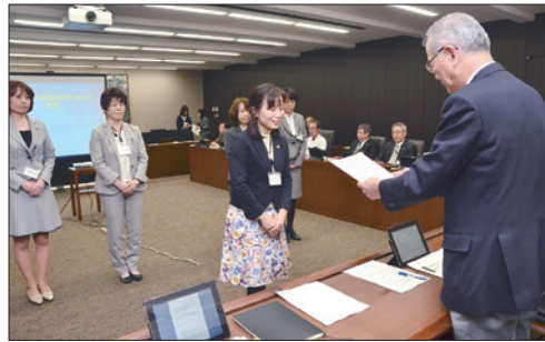
女性職員の活躍推進に向けた提言書を市長に提出 (平成28年3月)

答 平成26年度は約3%。自主財源割合が高いことで、円滑な行政運営ができるほか、将来を見据えたまちづくりのために自由度高く様々な独自施策を展開できることが挙げられる。