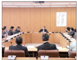
議員研修会の様子

策本部とどのように連携を図るのか、さらには、議会が機能を維持し、迅速な意思決定にどのように繋げていくのかなどについてご講義いただき、大変有意義な内容でありました。