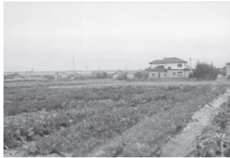
地産地消を推進し、安心安全な食を確保

問 観光事業の活性化において「みなくろの刈谷」を利用することはできないか。 答 各種イベントやお祭りは可能である。