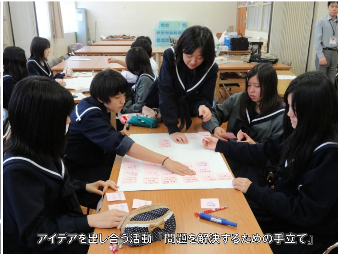
アイデアを出し合う活動『問題を解決するための手立て』