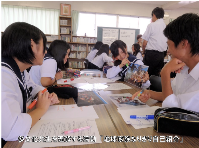
多文化共生を理解する活動『地球家族なりきり自己紹介』

ねん がつ かりやきたこうこう ちきゅうきほ かだい かんが せいとどうし たが いけん 2013年9～10月、刈谷北高校で、地球規模の課題を考え、生徒同士がお互いの意見を か で き かんが さんかがた こくさいりか いきょういく じゅぎょう おこな 交換し、出来ることを考える参加型の国際理解教育の授業が行われました!