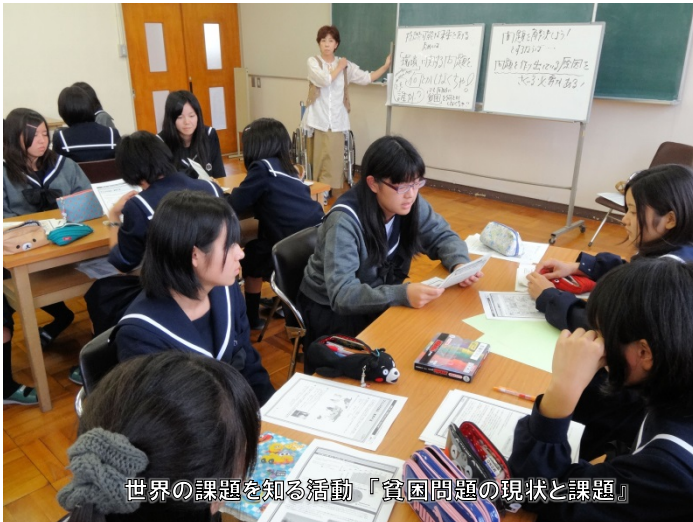
世界の課題を知る活動『貧困問題の現状と課題』