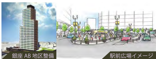
銀座 AB 地区整備