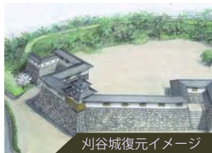
刈谷城復元イメージ