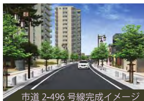
市道 2-496 号線完成イメージ