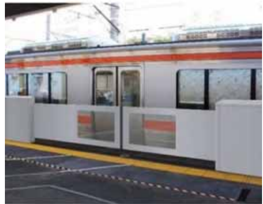
可動柵設置のイメージ（金山駅の試作機）