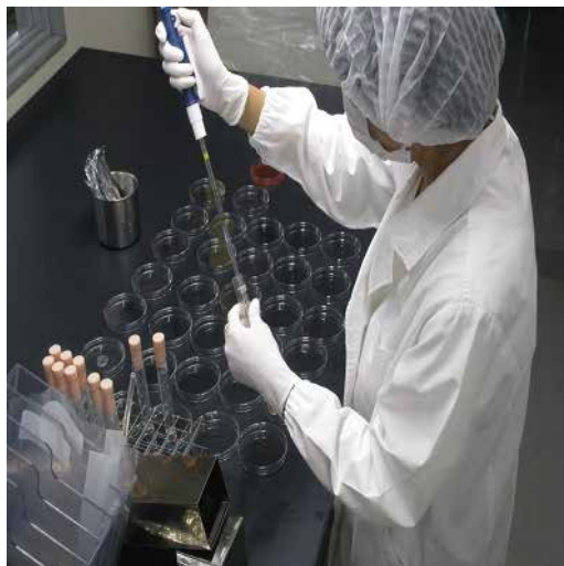
製品検査・同定業務： 食品に混入した異物の同定や菌検査を行い、食品の安全性を保障・サポートします。