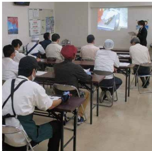
衛生点検： スーパーマーケットや食品工場・飲食店など定期的に衛生チェックを実施し、問題点の指摘や指導を実施します。