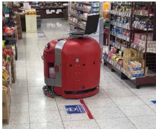
掃除ロボット： 夜間に無人状態でお店をきれいにします。