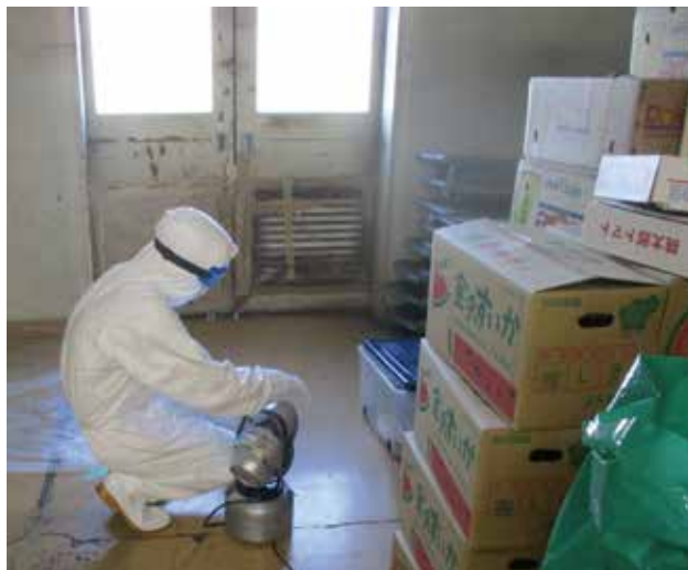
害虫獣防除： 安全性の高い薬剤を必要最低限使用し、害虫獣を駆除するだけでなく生息していない状態を実現維持します。