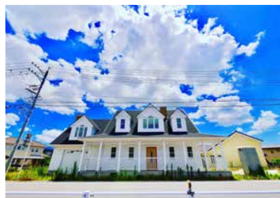
日本での施行事例