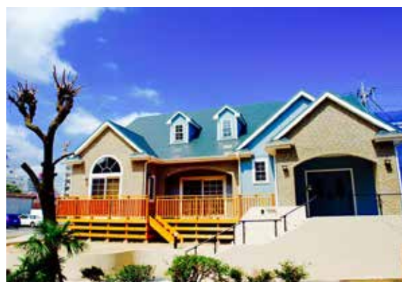
日本での施行事例