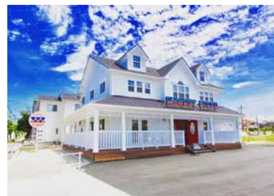
日本での施行事例