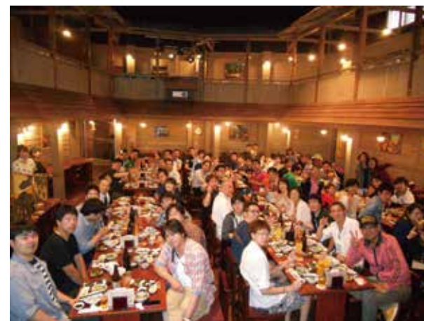
創立70周年記念 沖縄旅行の様子