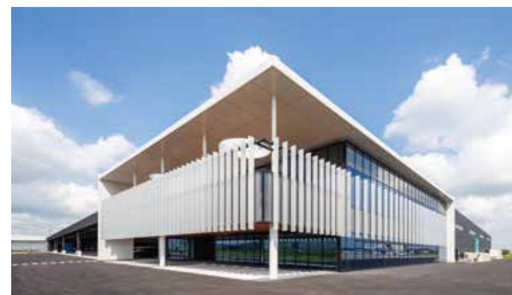
2023年竣工 本社・刈谷工場