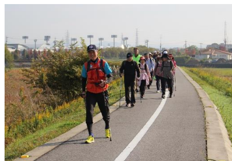
ルディック・ウォークステーション