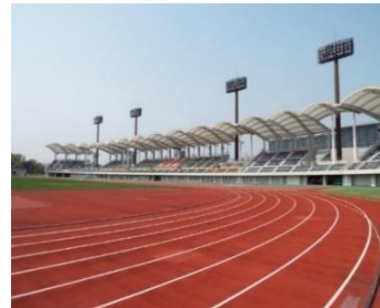
ウェーブスタジアム刈谷