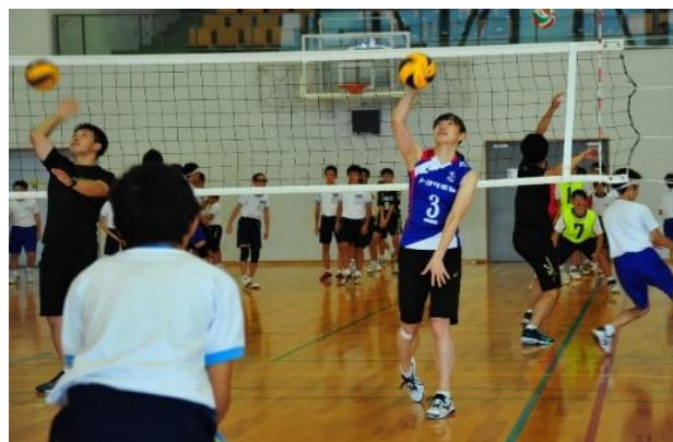
ホームタウンパートナーチームによる刈谷キラキラ教室