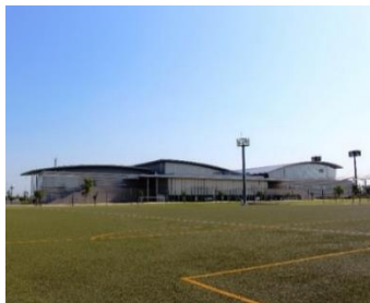
ウイングアリーナ刈谷（奥） グリーングラウンド刈谷（手前）