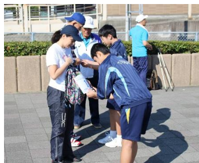
刈谷 GOGO ウォーキング大会のチェックポイントで 受付をする中学生ボランティアとスポーツ推進委員