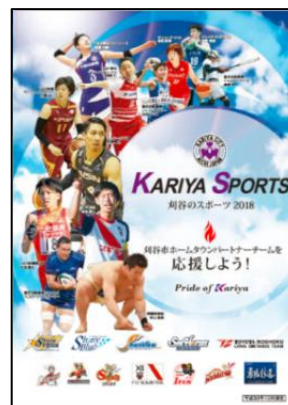
ホームタウンパートナー啓発用うちわ、リーフレット