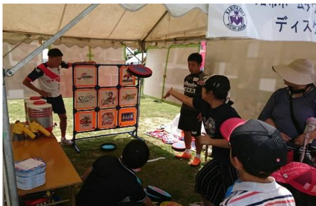
わんさか祭りにおけるホームタウンパートナーチームと市民との交流の様子