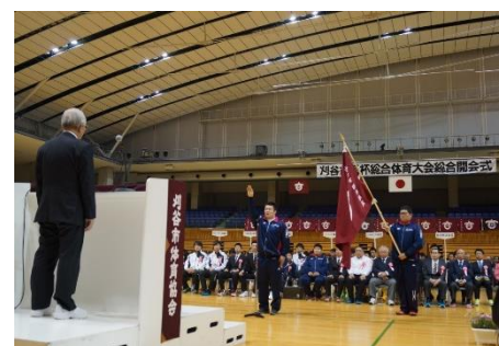
刈谷市長杯総合体育大会 総合開会式