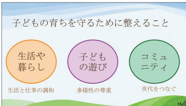
表1 分科会のグループワークテーマ