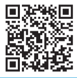
▲Website ng Kariya City