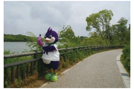
③ 風が気持ちいいね!