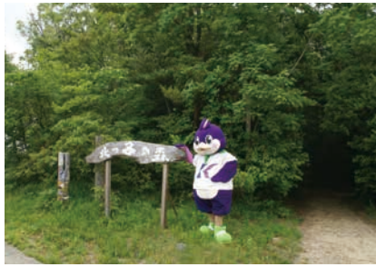
② 北っ子の森には緑がいっぱい