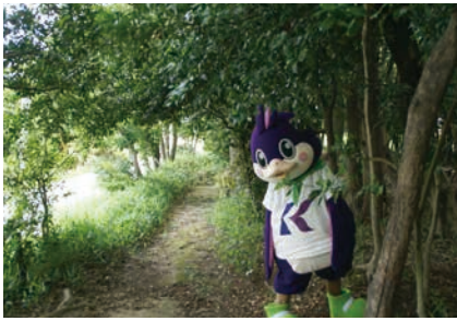
① 鎌倉時代にタイムスリップ!