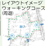
レイアウトイメージ ウォーキングコース (周遊)