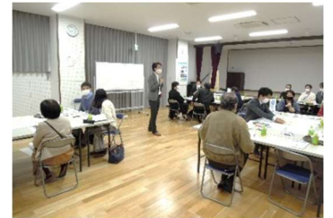
グループ全体の様子