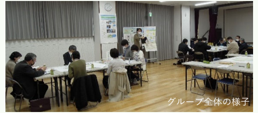
グループ全体の様子