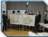
B・C 合同グループ発表の様子