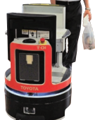
▲自律モバイルロボット