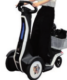
▲パーソナルモビリティ