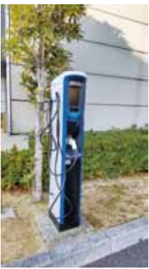
市内12か所の公共施設に普通充電器を設置

災害時に避難所で停電が起きた際の緊急の動力源として、電気自動車の蓄電池の活用を推進すべきと考えるが市の見解は。