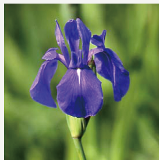
市の花 カキツバタ

あたたかい地方に多く自生する常緑高木で、刈谷市の気候にもよく適合しています。成長も早く公害にも強いいため、市内には多くの巨木がみられます。