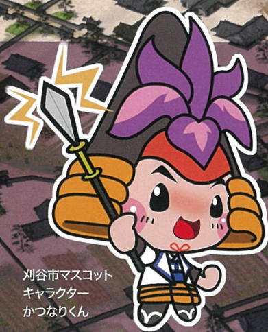
刈谷市マスコットキャラクター かつなりくん