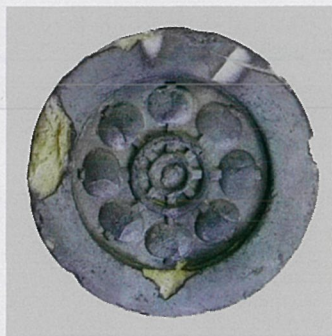
土井家 八本柄杓水車紋