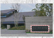
<歴史博物館の看板>

記念撮影の場合は、上にあるQRコードを読み取った後、歴史博物館の看板にスマホをかざすと、画面にかつなりくんが現れます。