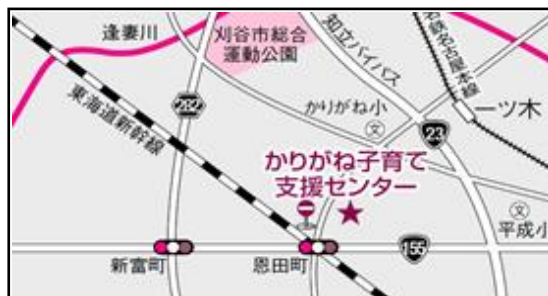
【かりがね病児ケアルーム】

★保育中に病状の変化や受診、新たな処置が必要になった場合は、保護者の方にご連絡させていただきます。その場合は、お子さんのために少しでも早いお迎えをお願いいたします。