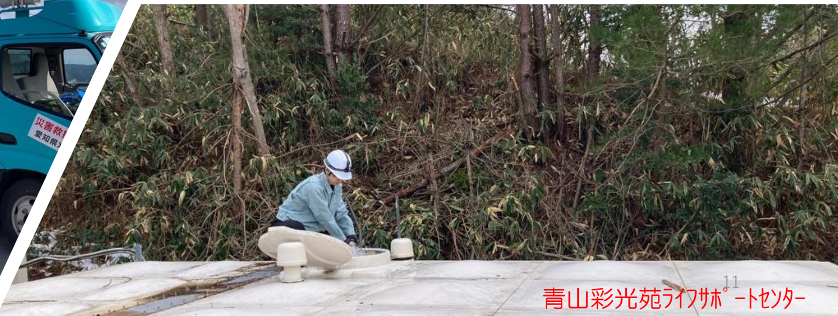
青山彩光苑ライザールームセンター