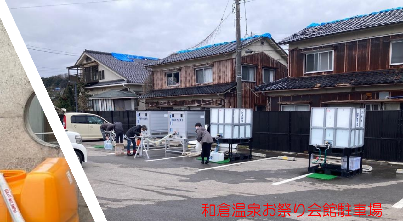
和倉温泉お祭り会館駐車場