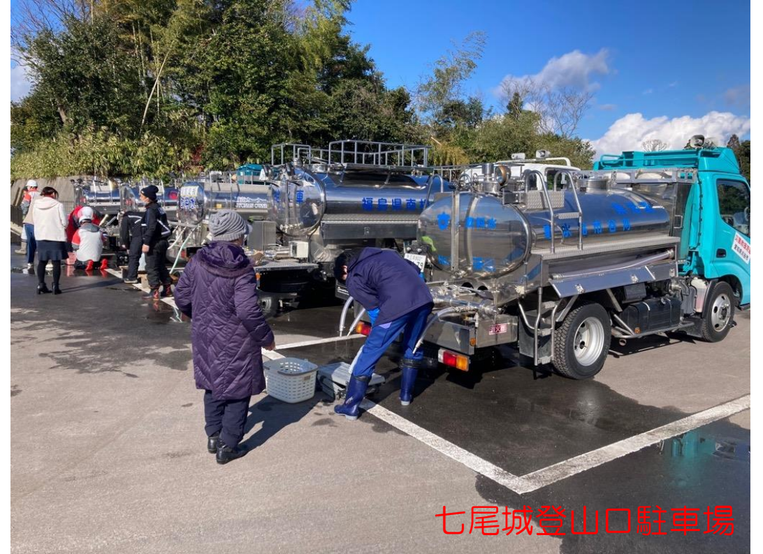
●前任市からの引継