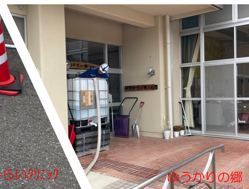
ねがみみらいクリニック