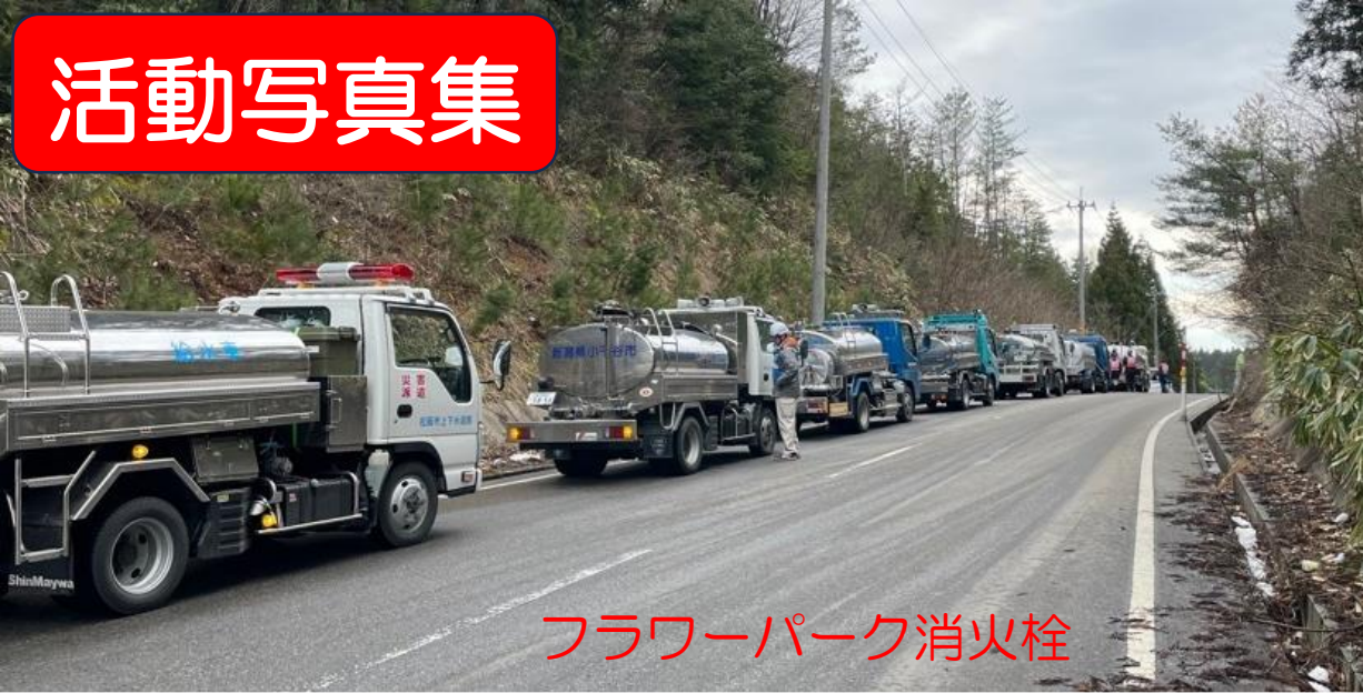
フラワーパーク消火栓