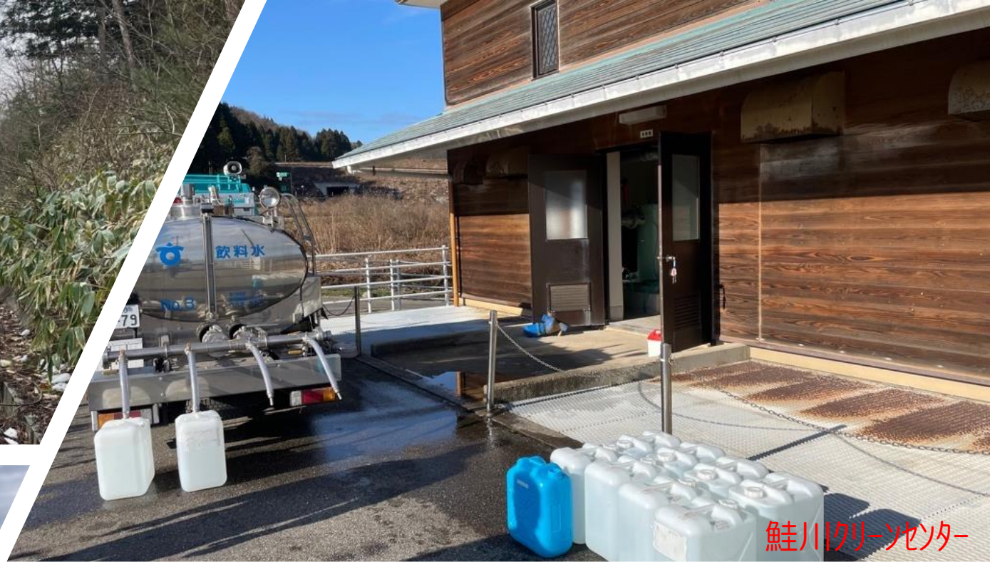
鮭川クリーンセンター