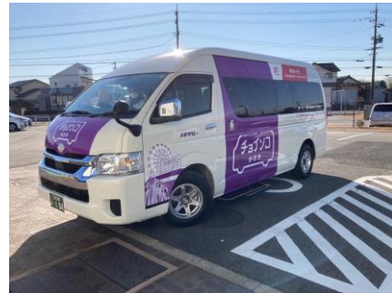
■チョイソコかりや