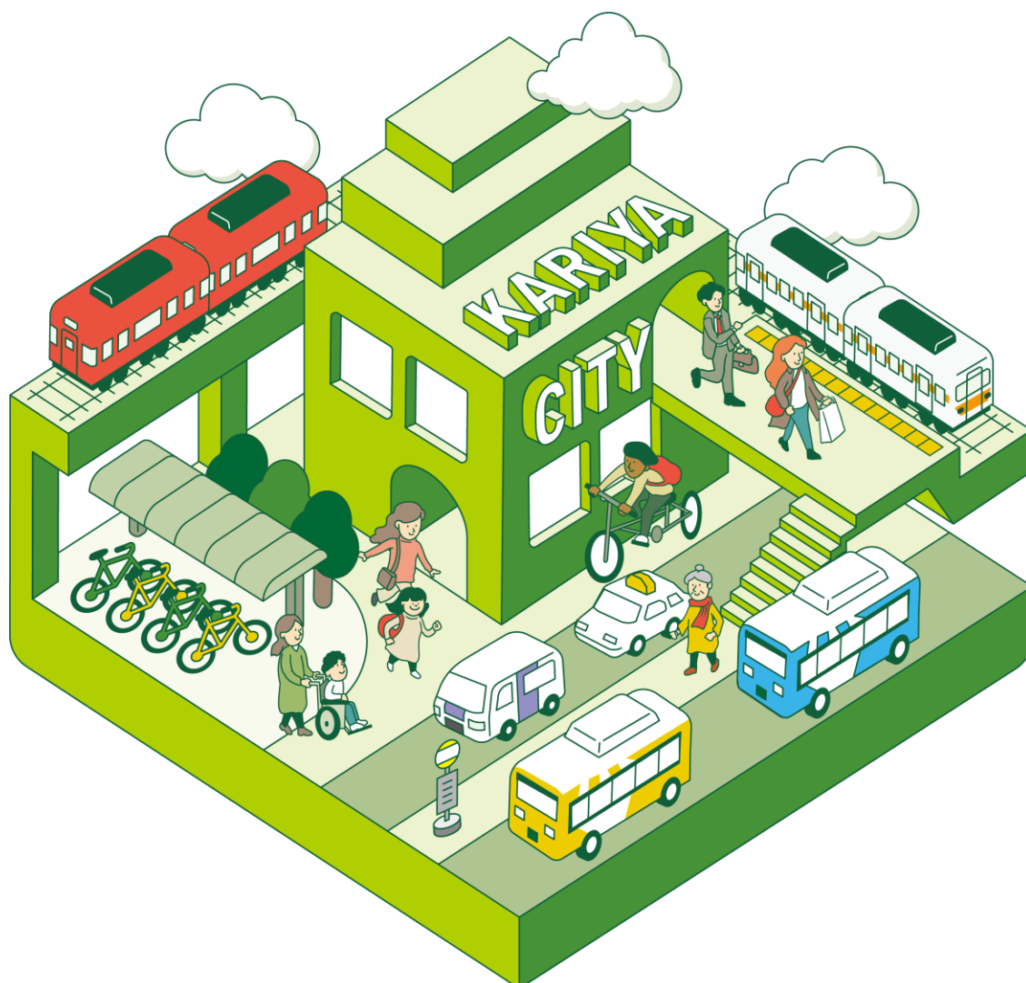
■様々な交通の乗継拠点