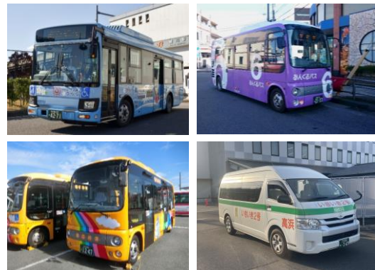
■隣接市町のコミュニティバス