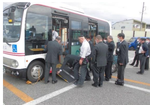
■バリアフリー講習