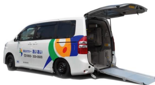
■福祉タクシーあいあい