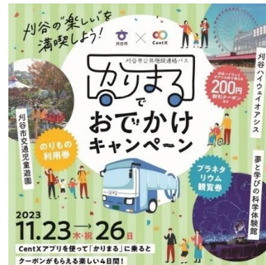
■かりまるの利用促進イベント