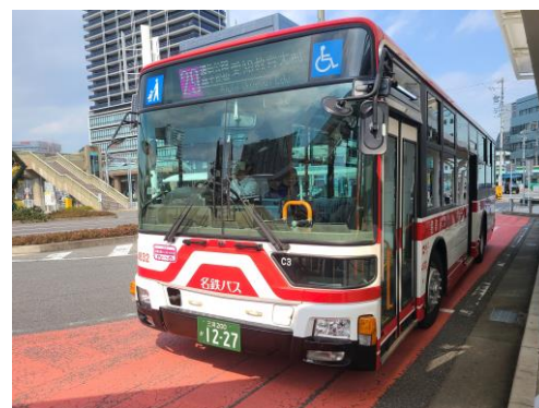
■ 名鉄バス刈谷・愛教大線