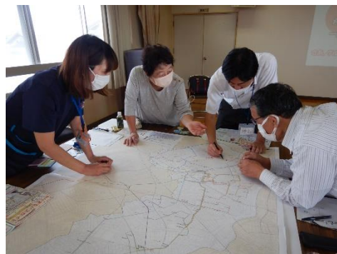
■公共交通に関する意見交換会