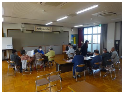
■チョイソコかりやの利用者説明会