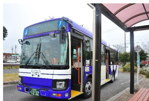
■ 公共施設連絡バス「かりまる」