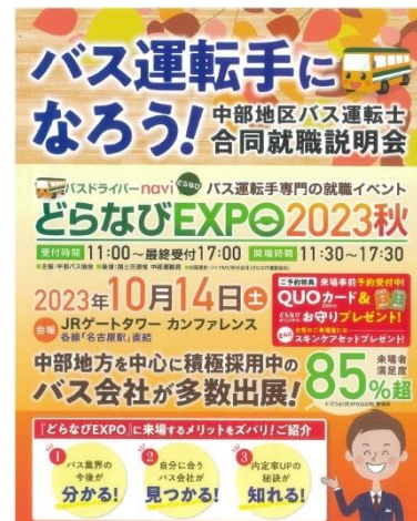
■乗務員確保に向けた啓発活動