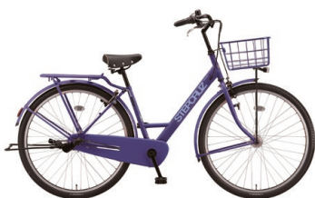
▲ブリヂストン自転車 (26インチ、3段変速)